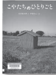
こやたちのひとりごと 谷川 俊太郎

各地にあるぼつんと建つ小屋が、まるで自分の気持ちを語るかのようにひとりごとをつぶやきます。人との思い出や時間の流れを、写真で静かに表現した、温かくも少し切ない絵本です。津南町にもこんな小屋があるかな?