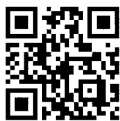
津南町暮らし ホームページQRコード