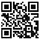
android 用 QRコード